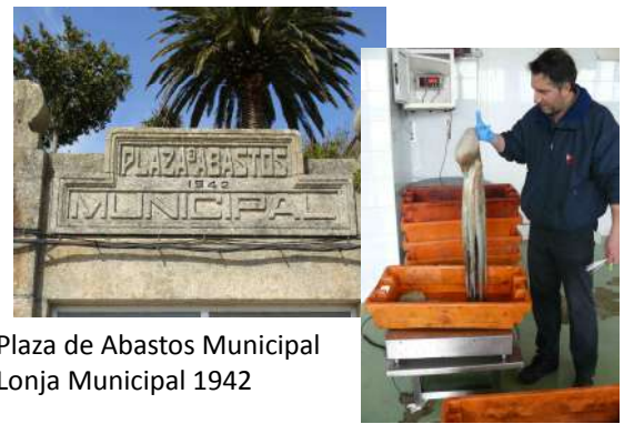
Plaza de Abastos Municipal Lonja Municipal 1942