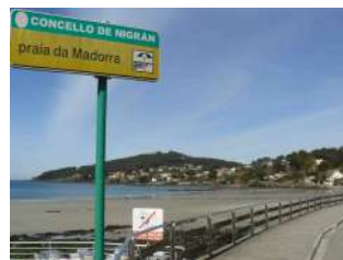
Playa de la Madorra. Aquí apareció el cuerpo sin vida de el "Rubio".