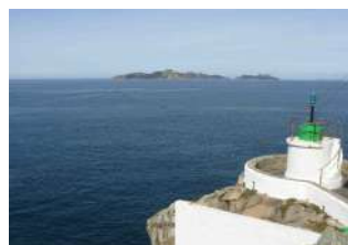
Faro de Punta Lameda con las Islas Cíes al fondo (Monteferro).