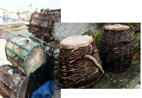
Nasas actuales y nasas tradicional. El “rubio” solía pescar nécora y camarón. Hoy solo se pesca pulpo.

9. Manuel Trabazos , el doctor amigo del padre del inspector Leo Caldas y vecino de Panxón, conoce el mundo marineru y facilita información a Leo en sus investigaciones.