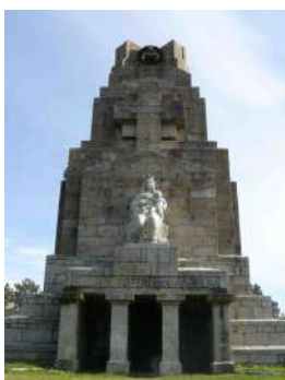
Monumento a la Marina Universal, conmemora las víctimas de los naufragios de las 4 marinas: mercante, pesca, deportiva y de guerra. (Monteferro)