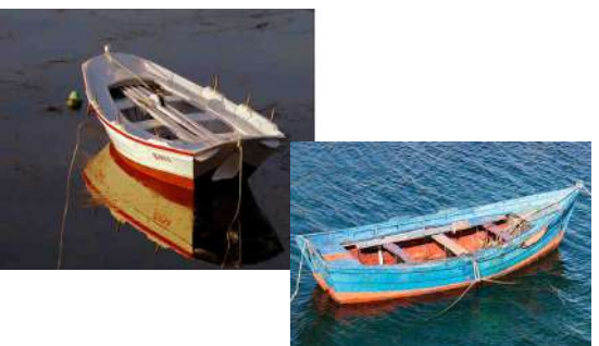
Gamela (proa plana) y Chalana (en punta)