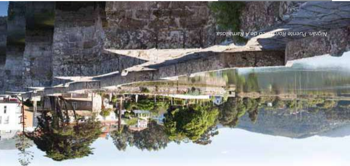
Nigrán. Pazo Románico de A Ramallosa.

Durante a Idade Media existían gran cantidade de camiños que percorrían o territorio en dirección a Santiago de Compostela, tendo especial importancia os camiños procedentes de Portugal. Dentro destes camiños de peregrinación, destaca o CAMIÑO PORTUGUÉS POLA COSTA, que transcorre desde A Guarda ata Redondela, onde se une co Camiño Portugués tradicional para chegar a Santiago. Esta ruta era seguida polos peregrinos procedentes das terras máis occidentais, aqueles que desde países de ultramar arribaban aos portos portugueses para chegar a Compostela seguindo este vello camiño costeiro. A súa importancia certíficana os topónimos, elementos de devoción xacobea e antigos hospitais e hospedadarías que atendían aos peregrinos como os de Viana do Castelo e Carmiña. Dende aquí cruzaban o río Miño en barca ata a beira deixando atrás Portugal, para continuar atravesando os concellos de Vigo, ata que chegaban a Redondela, onde continuaban a mesma ruta que facían os peregrinos procedentes do camiño portugués que transcorre polo interior.